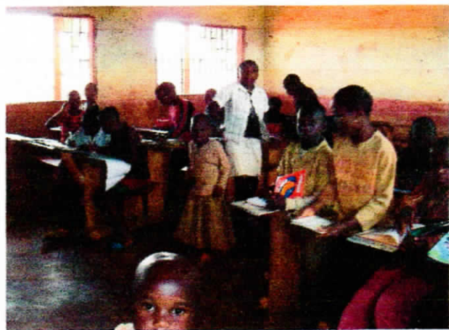
← 本閲覧と同時にやっている、日本語授業。 一生懸命、ノートをとっていました。