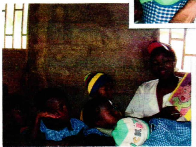
↑ 幼稚園では、先生が絵本を使って授業。