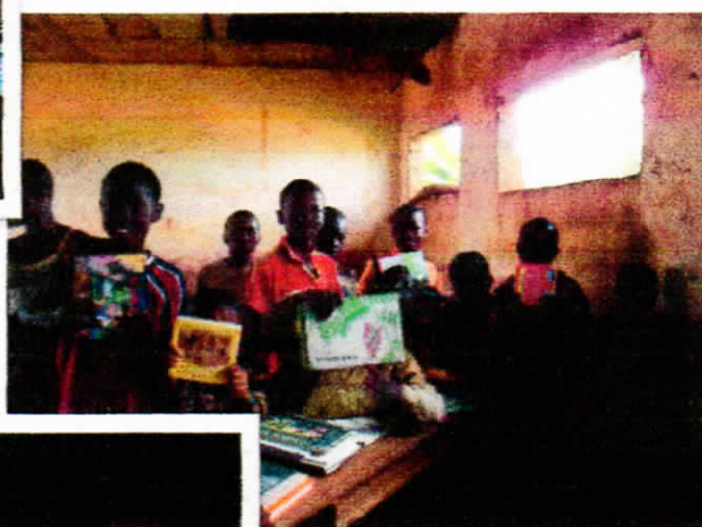
↓ 小学校の教室を借りて、本の閲覧を行っています 好きな本をそれぞれ選んで…