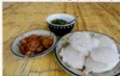
シマは、 手で食べます