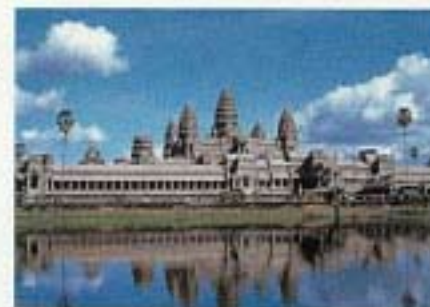
アンコールワット遺跡