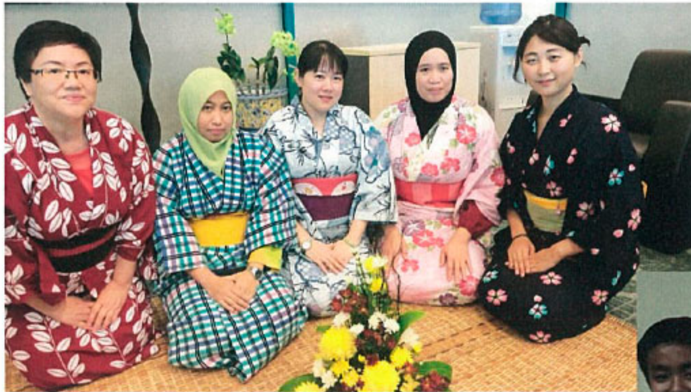
サラワク州立図書館 のスタッフと

⑥サラワク州立図書館と地域の方々の交流のために品物をご提供くださりありがとうございました。サラワク州立図書館は地域の方に開かれた図書館ですので、今後いただいた品物は学校関係者以外にも様々な方にご利用いただけたらと思います。サラワク州立図書館職員一堂、また、これらの品物を手に取ったマレーシア人たちからの、心からの感謝をお伝えいたします。どうもありがとうございました。