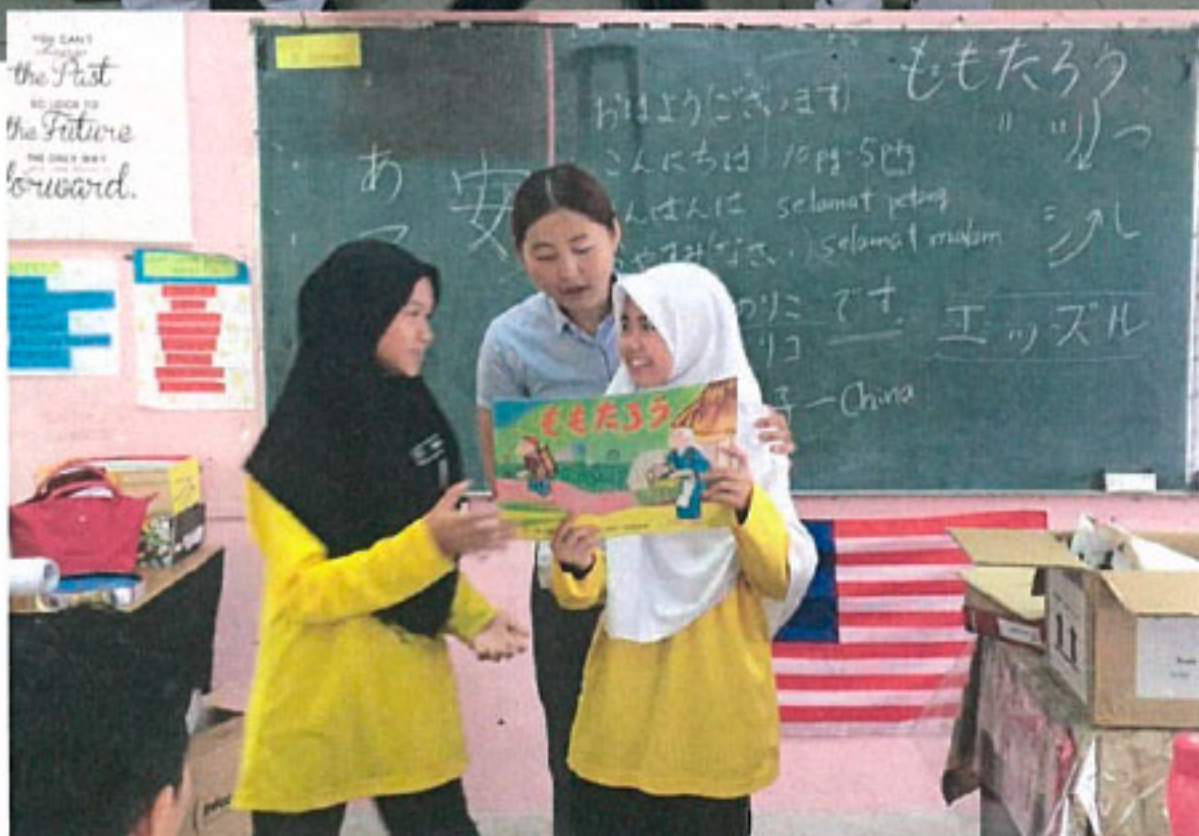
アブディラ中学校 (Kolej DPAH Abdillah) の一年生 たち