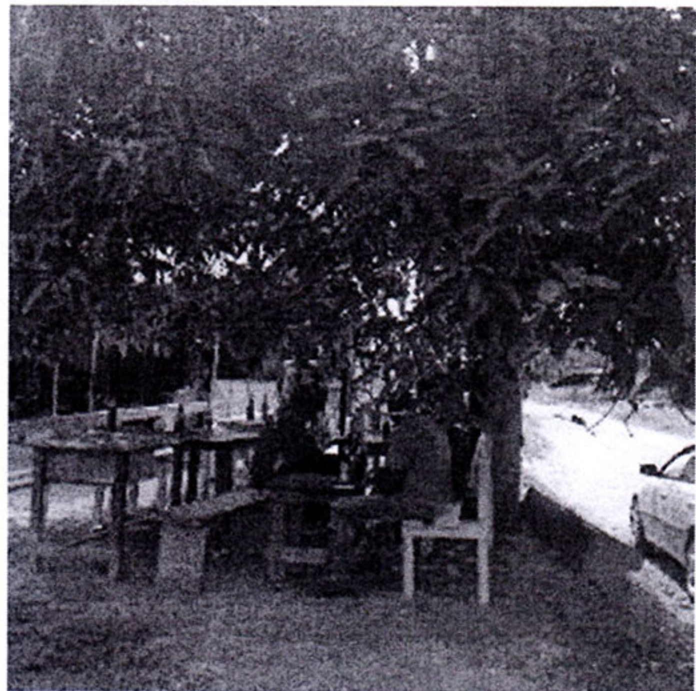
2 マンゴーの木の下バー