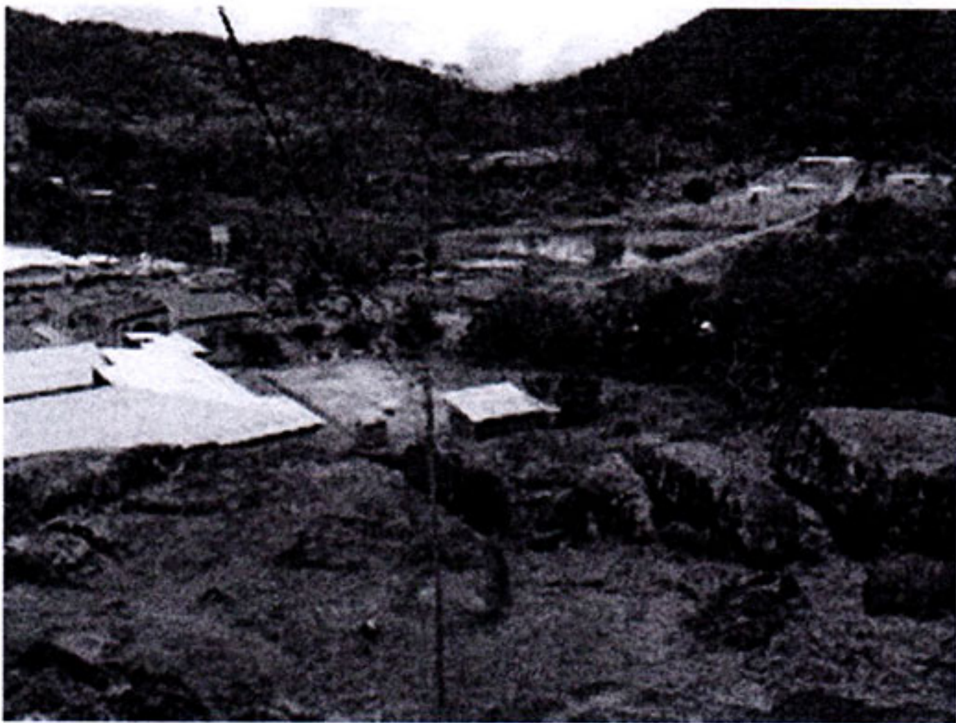
1 カメルーンの風景

も多くいます。キリスト教と、イスラム教が多くを占めている国なので、お互いの宗教上の祭日が、カメルーン国内の祭日と定められています。気候は、国土の大半が熱帯に属し、沿岸地域と南部は高温湿潤な熱帯雨林気候、中部はサバナ気候、北部は高温乾燥のステップ気候と言われています。北部の乾季は7~8月ですが、南部では1~2月が乾季で、南西モンスーンの吹く3~10月は大雨季となり、年間降水量は4000mmを超えます。首都ヤウンデの年平均気温は23℃、平均湿度は82%です。アフリカといえば暑いイメージがあると思いますが、カメルーンはとてもしやすい国です。最後に食べ物についてです。大別すると北部の遊牧の民・農耕の民と、南部の森林にすむ農耕の民とは食生活はかなり異なります。というより、基本的な食生活は似ていますが、主食としての食材が違います。沿岸部を含めた南部では、キャッサバ、食用バナナなどを主食の材料にし、調理にはパーム油をよく使います。海岸部では魚もよく食します。北部では、モロコシ、ヒエ、ソルガム等の雑穀類が主食の食材になり、肉類は羊や牛が主となります。都市部ではフランスの影響でパンも多く出回り、味も美味しいです。そんな多様な食文化の中で、カメルーンの国民食と呼ばれているのが「ンドレ」です。これは、細かく刻んだンドレ（キク科植物で、カメルーンでは腹痛や頭痛などの治療のためにも用いられる薬用植物）の葉を牛肉、鶏肉、エビや干し魚と一緒にピーナッツペーストで煮込んだものです。薬用植物のンドレを食べれば、健康になること間違いなし！です。