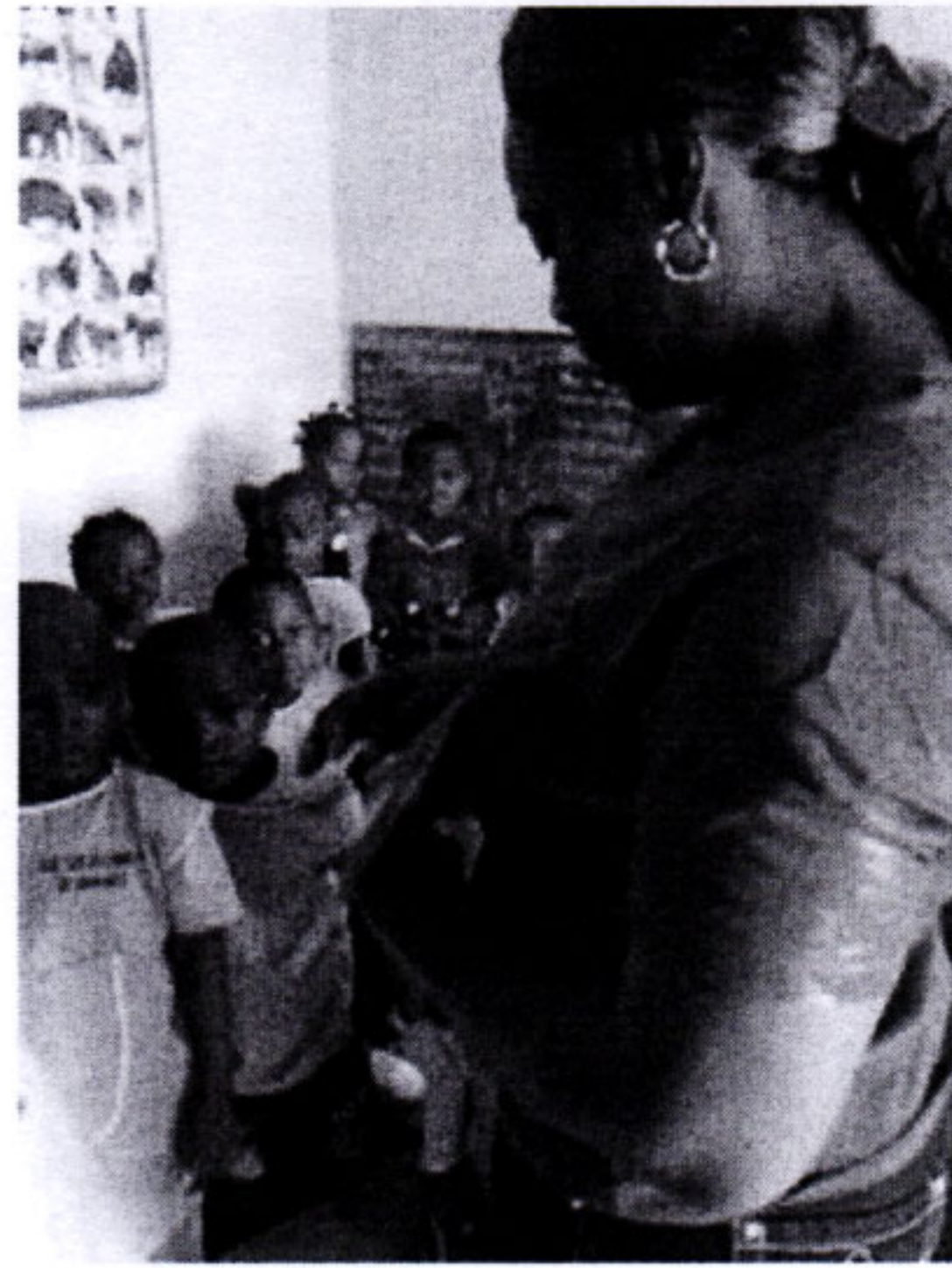
7 絵本を読んでいる様子

今回、日本人ボランティアを通じて、素敵な贈り物を受け取りました。贈っていただいた絵本たちは、大切にに使わせていただきます。私たちのために、本当にありがとうございました。